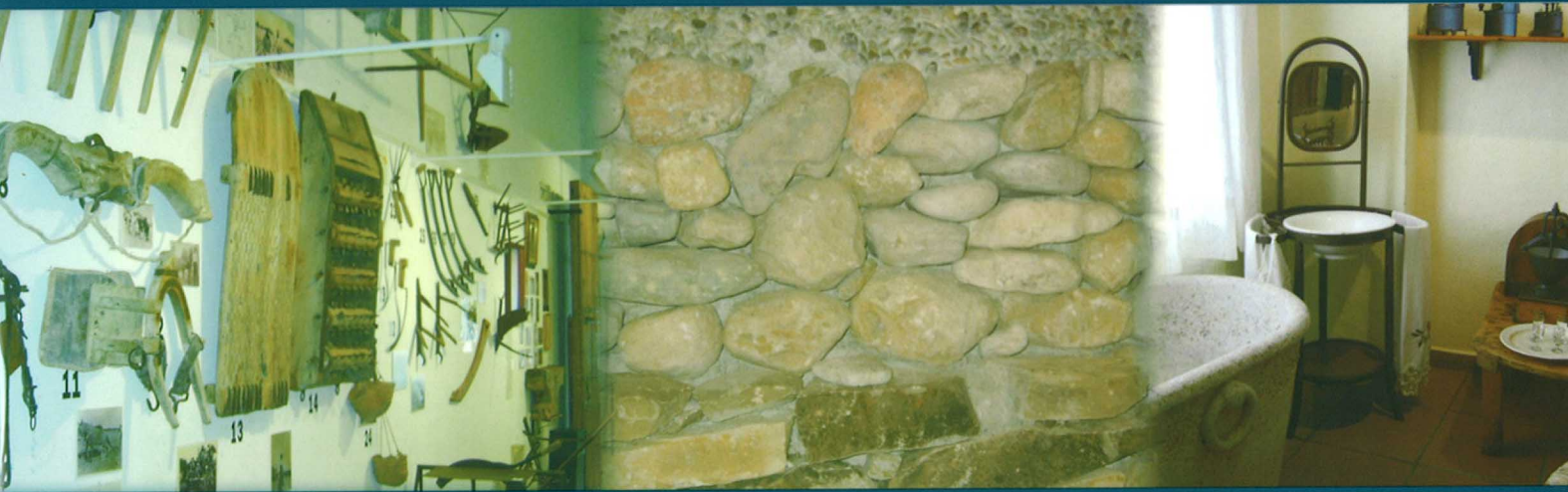
Pilar de la Horadada